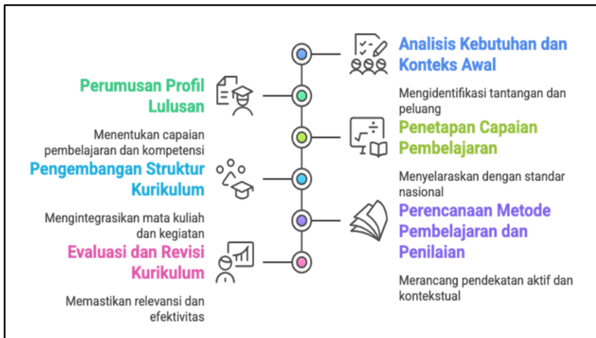
Gambar 1. Tahapan Pengembangan Kurikulum Fakultas

Pengembangan kurikulum Fakultas Ilmu dan Ilmu Politik dilakukan secara sistematis dan terstruktur untuk menjamin keselarasan antara visi institusi, perkembangan keilmuan, serta kebutuhan masyarakat dan dunia kerja. Dalam proses ini, pendekatan Outcome-Based Education (OBE) digunakan sebagai paradigma utama yang berfokus pada capaian pembelajaran lulusan, dengan mengacu pada regulasi terbaru, khususnya Permendikbudristek Nomor 53 Tahun 2023 tentang Penjaminan Mutu Pendidikan Tinggi. Setiap tahapan pengembangan kurikulum dirancang agar adaptif terhadap dinamika sosial politik, demokrasi yang semakin kompleks, dan tuntutan akan pendidikan yang inklusif, partisipatoris, serta berbasis nilai-nilai kebangsaan.